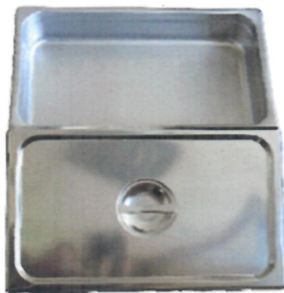
圖 4、不銹鋼盛菜盆示意圖