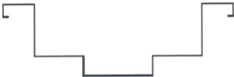
圖 2、保溫配膳台加熱槽剖面示意圖