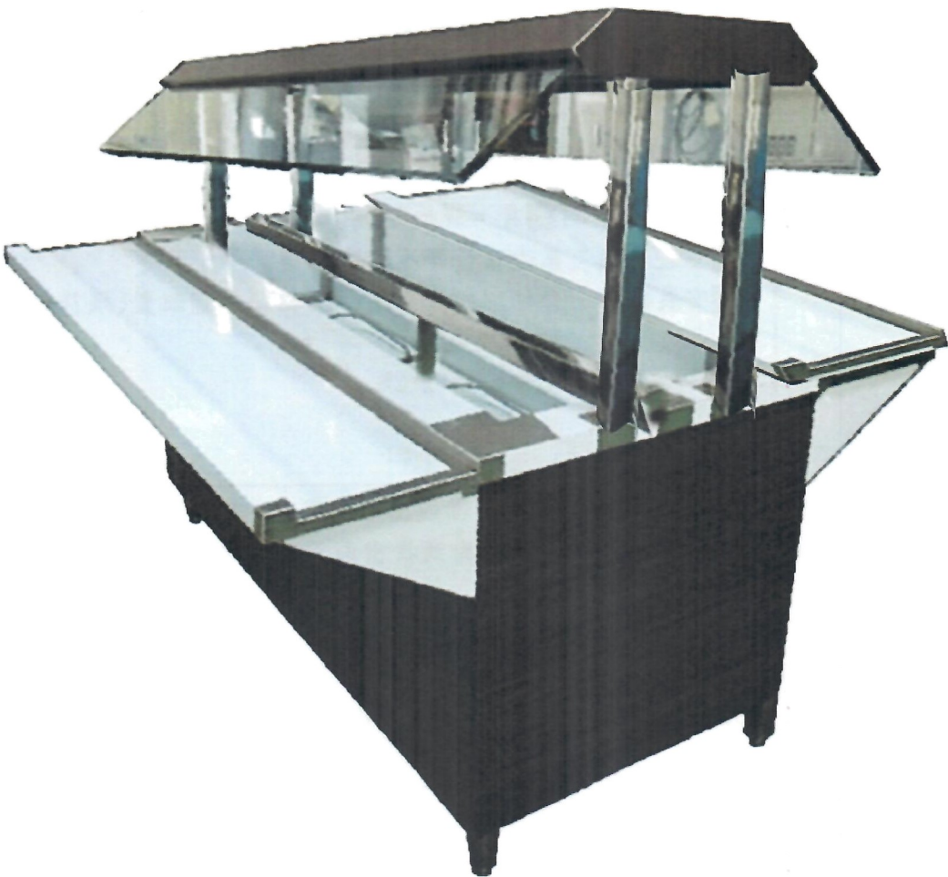
圖 1、保溫配膳台示意圖