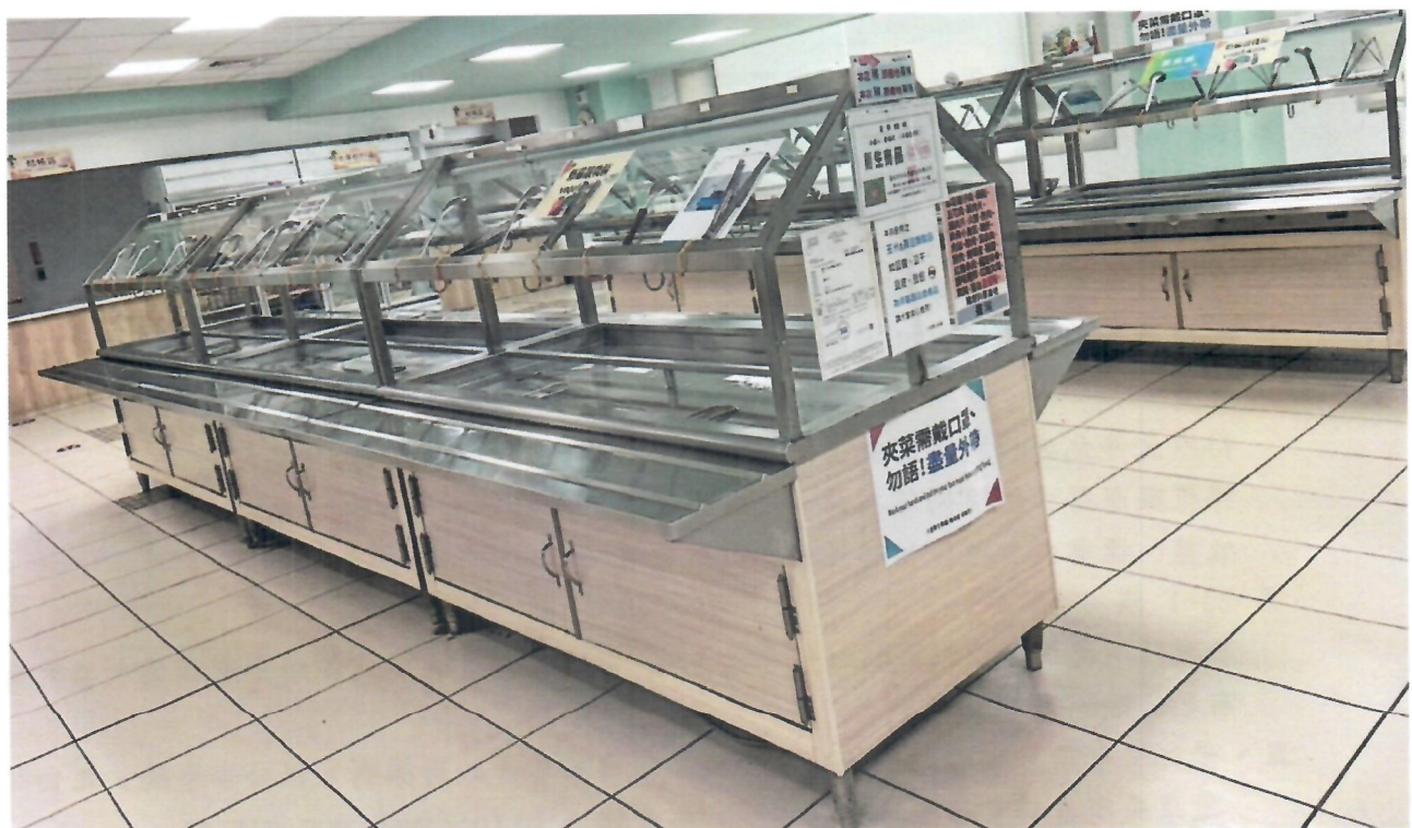
圖 5、現有保溫配膳台示意圖